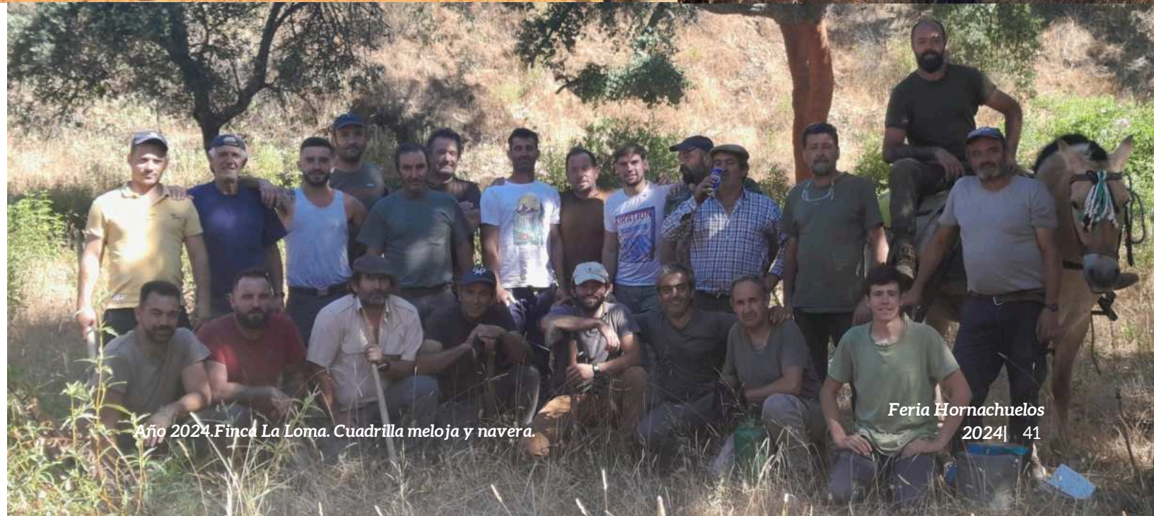
Año 2024. Finca La Loma. Cuadrilla meloja y navera.